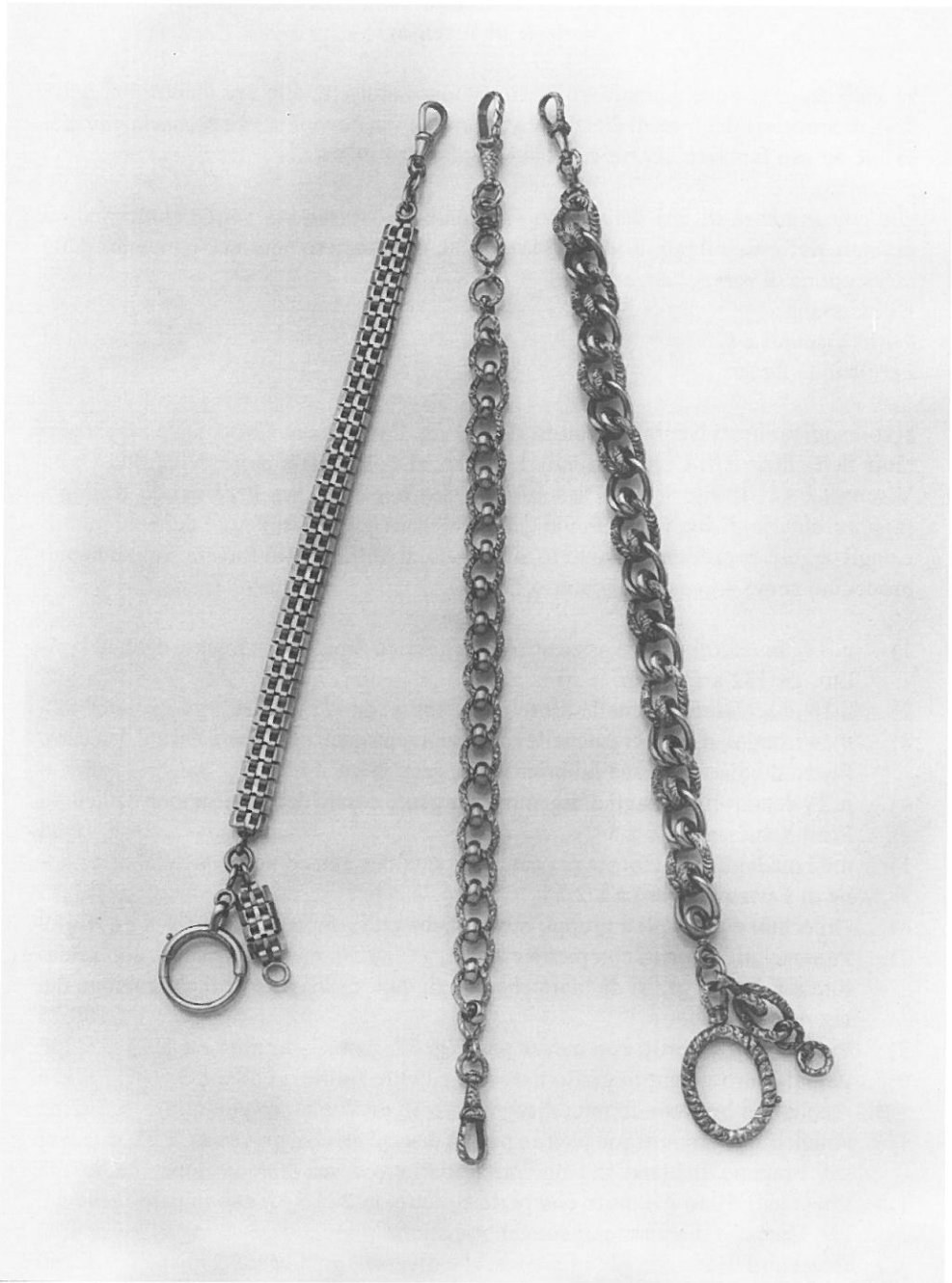
Tre catene da orologio, manifattura tedesca, 1895 ca., oro giallo.